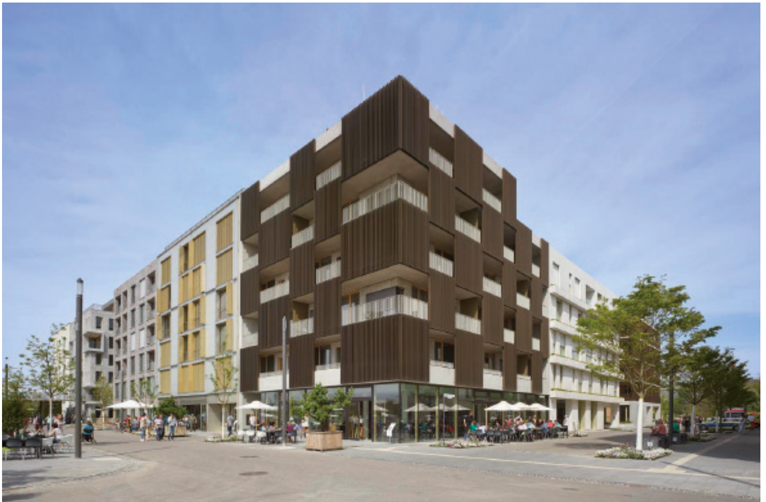
WOHNQUARTIER DER VIELFALT IM NECKARBOGEN HEILBRONN Baufeld I, Haus 3, CINARI Suites - Wohnen auf Zeit, Fotograf: Roland Halbe