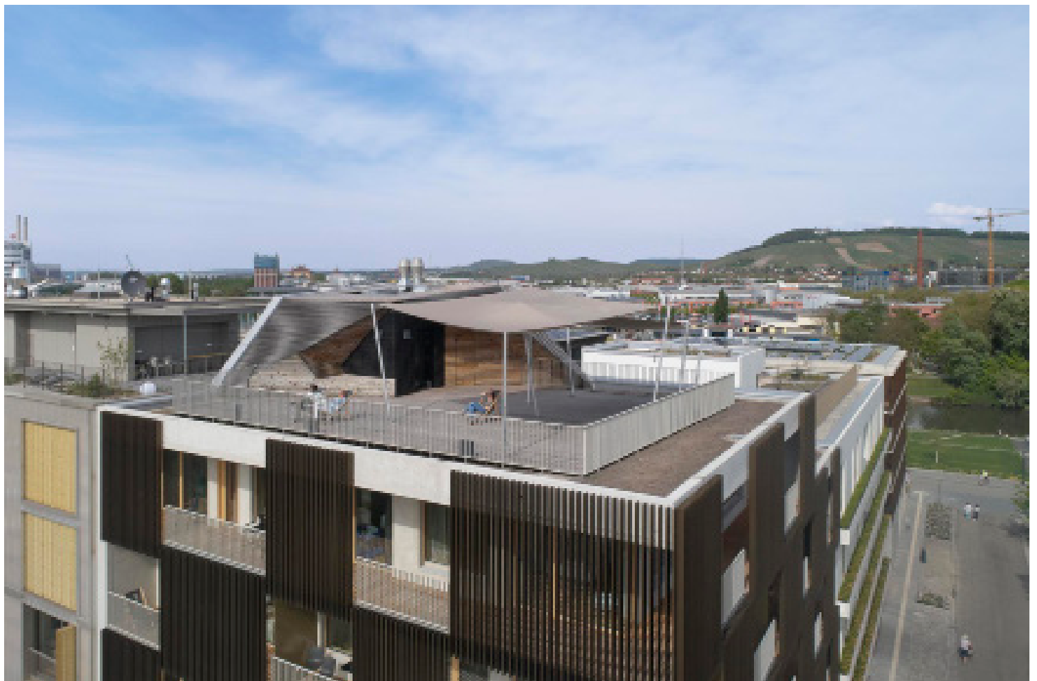
WOHNQUARTIER DER VIELFALT IM NECKARBOGEN HEILBRONN Baufeld I, Haus 3, CINARI Suites - Wohnen auf Zeit