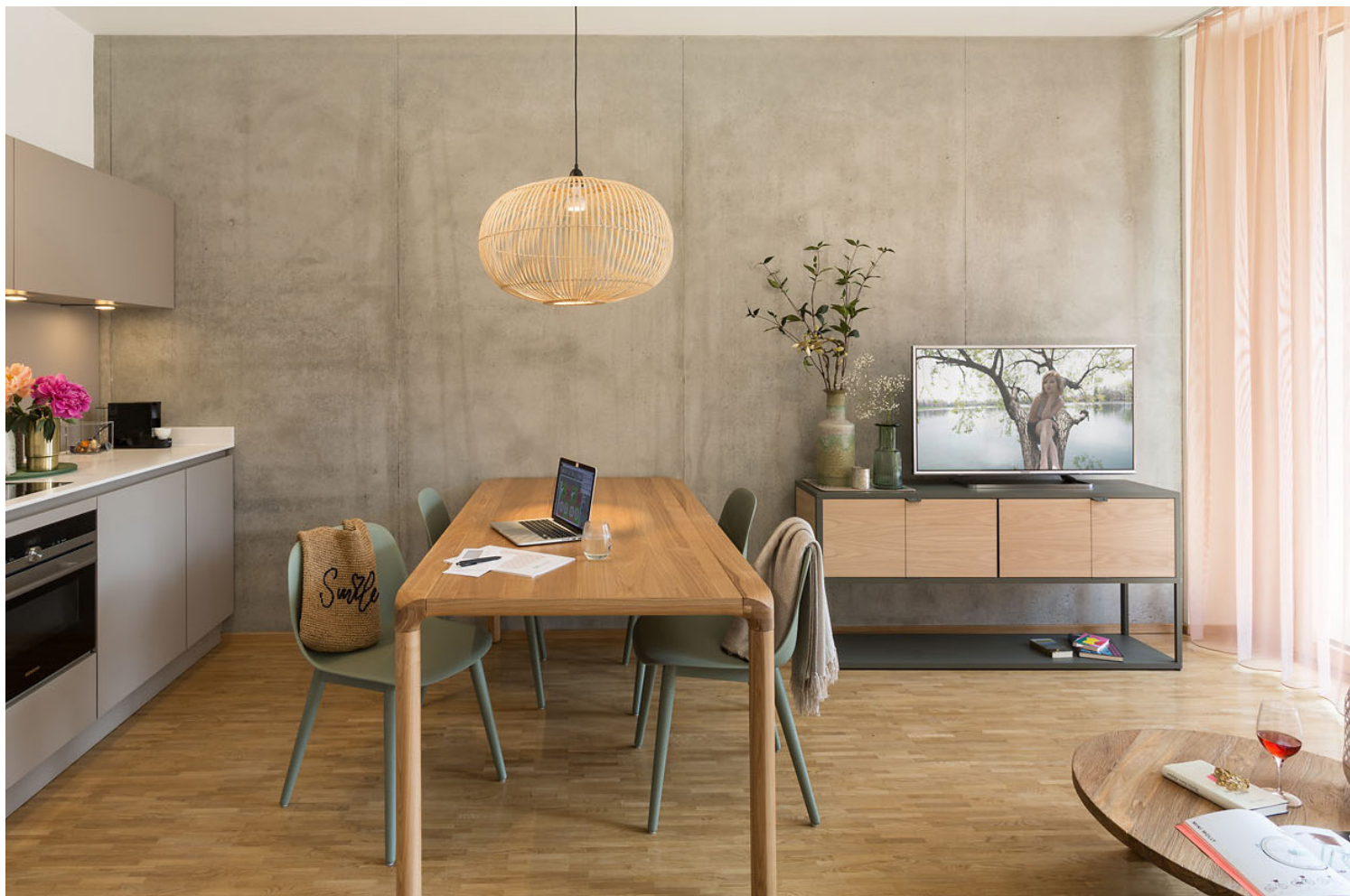
WOHNQUARTIER DER VIELFALT IM NECKARBOGEN HEILBRONN Baufeld I, Haus 3, CINARI Suites - Wohnen auf Zeit, Fotograf: G. Thunert